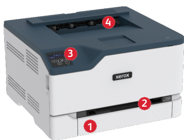
Xerox® C230 színes nyomtató