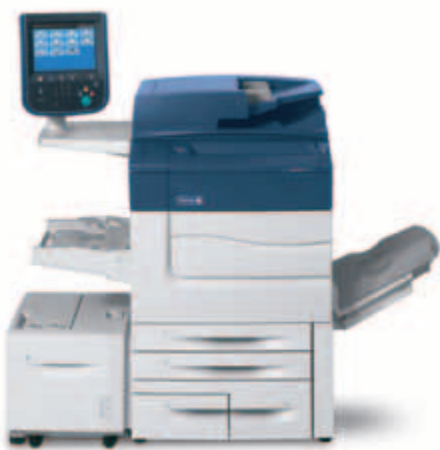
A Xerox® C60/C70 a nagykapacitású adagolóval.