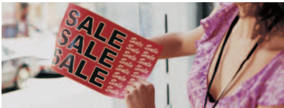
Xerox® NeverTear ablakmatricák

Speciális, poliészter EA alacsony olvadáspontú festékünk a kimenetet a saját kémiai kötési módszerünkkel a poliészterbe égeti, ami páratlan képminőséget eredményez a különleges alaprétegeken, mint például a poliészter stb. Az EA festék (Premium NeverTear-t tartalmaz) víz-, olaj-, zsír- és szakításálló.