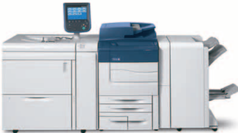
A Xerox® C60/C70 az egytálcás, túlméretes nagykapacitású adagolóval és a BR fűzetkészítő finiszerrel.